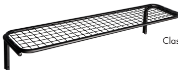
Classic Shoe Rack, single

Please note! Screws for fixing to wall are not included but can be purchased through us. For advice on suitable screws and plugs, contact your specialized dealer